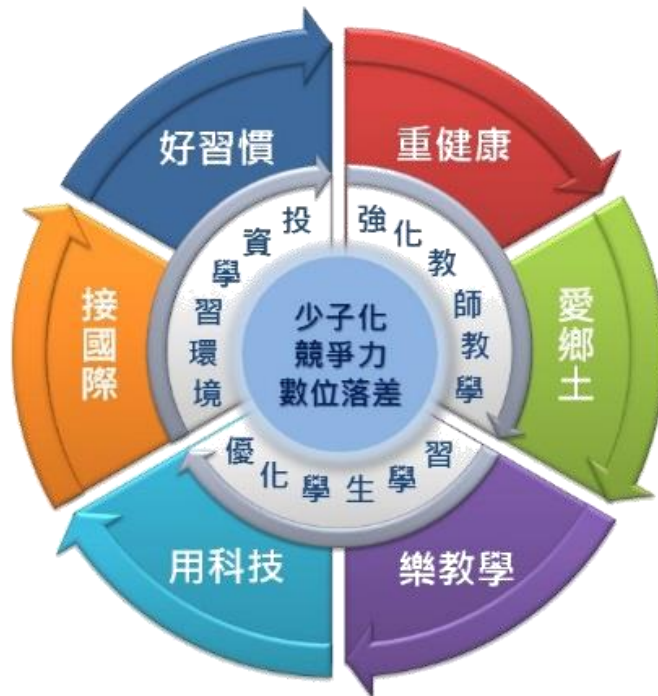
圖 2：嘉義縣 創新教育白皮書 架構圖